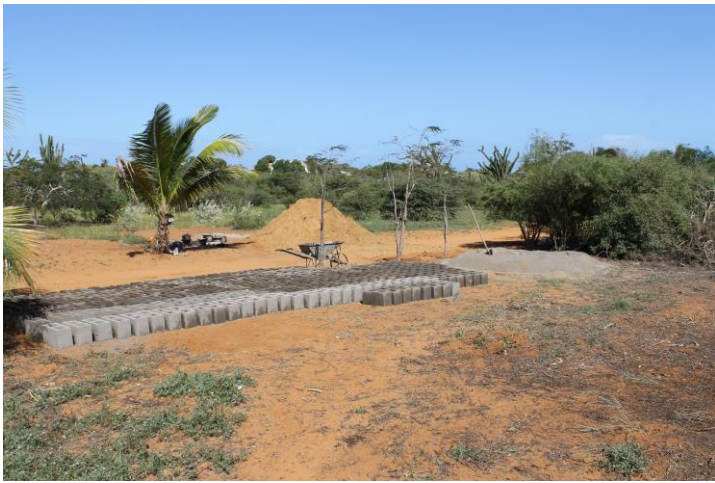
2016 : Construction d'un logement pour la deuxième institutrice