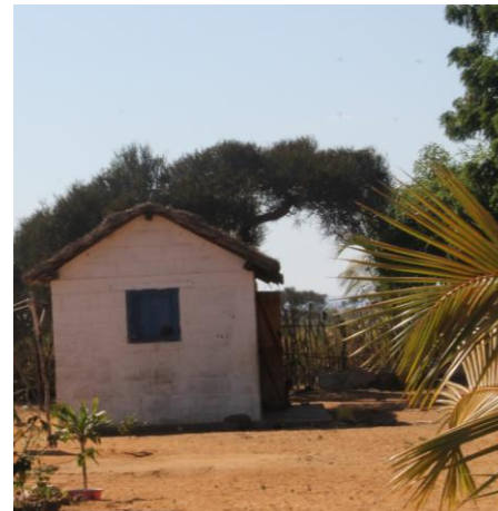
Agrandissement des cases des deux gardiens. On double leur surface.