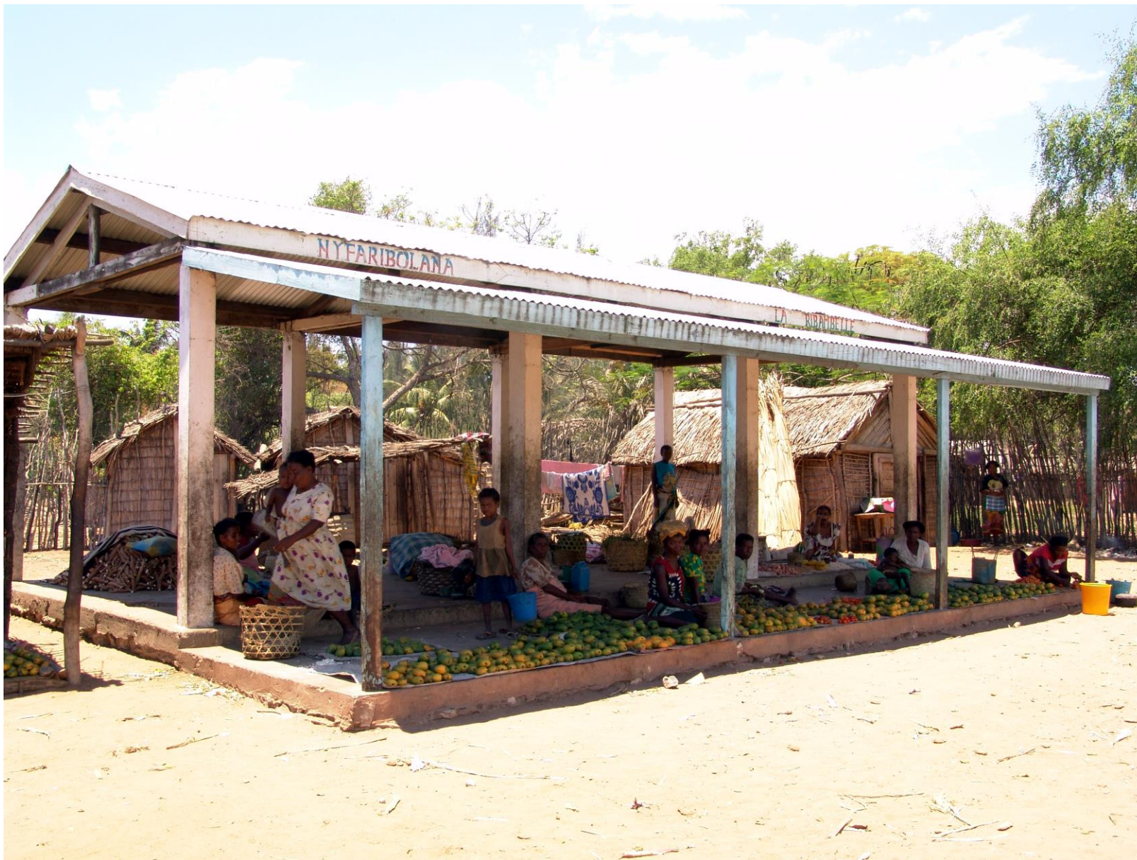
2001 : À la demande des villageois, construction d'un marché couvert au centre du village.