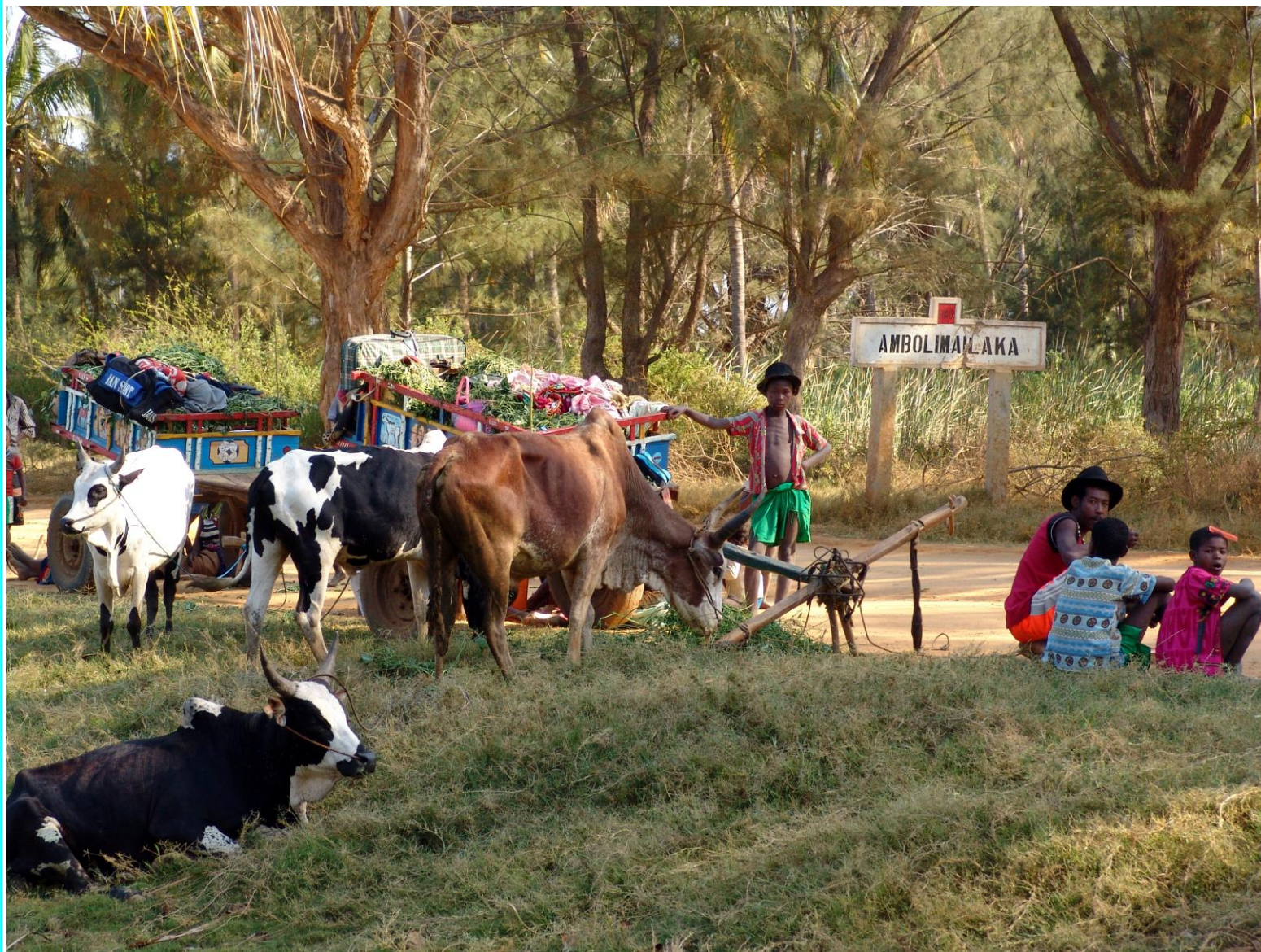
Achat d'un terrain de 6 hectares à Ambolimailaka, petit village de pêcheurs au Nord de Tuléar.