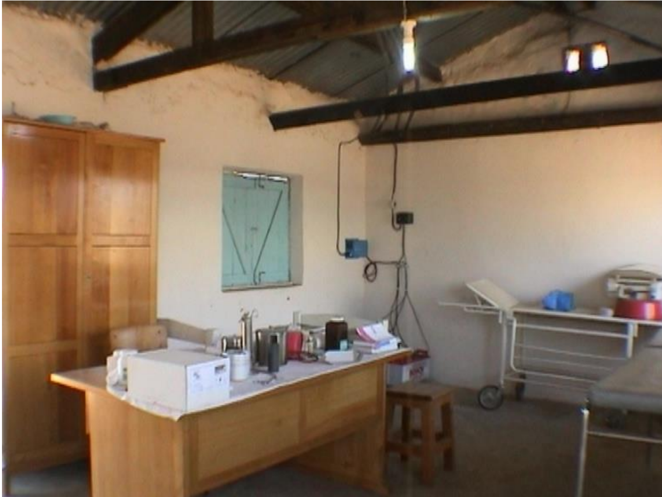
Équipement du logement du médecin et du dispensaire