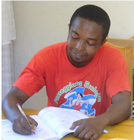
ODON : directeur de l'école