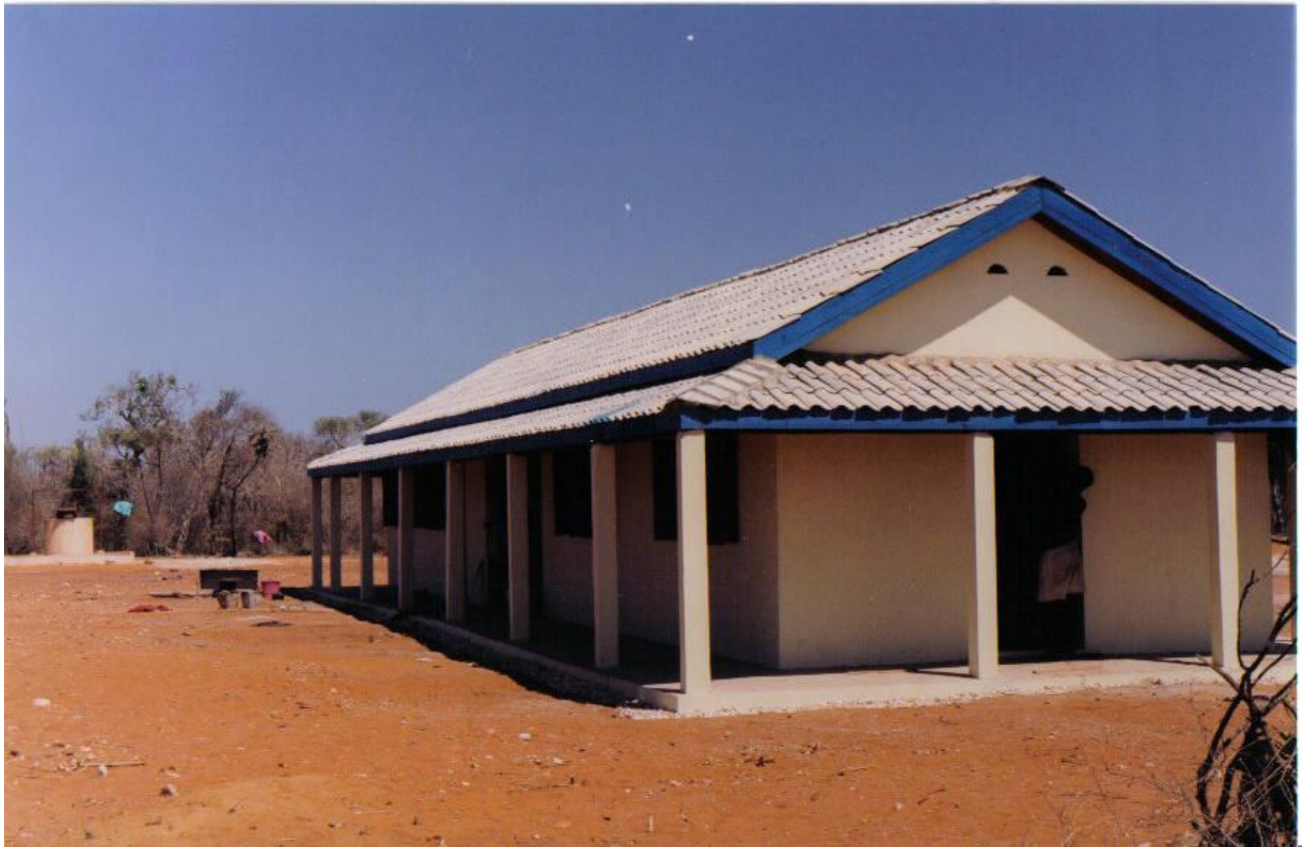
1998 : Construction du dispensaire