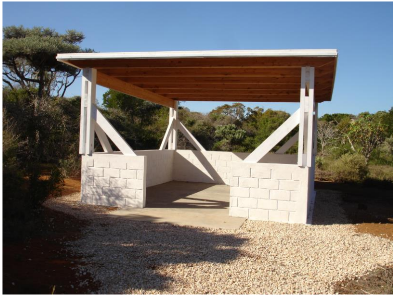
Construction d'un préau réfectoire de 30 m 2 avec tables et bancs.