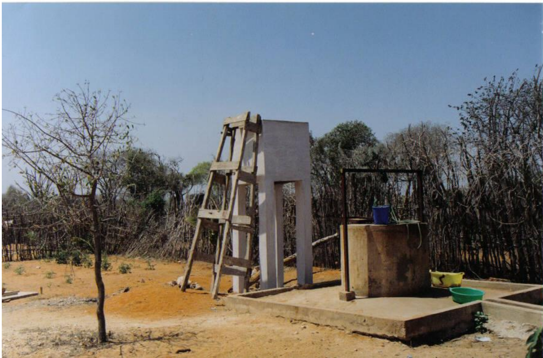
Forage d'un puits et construction d'un château d'eau