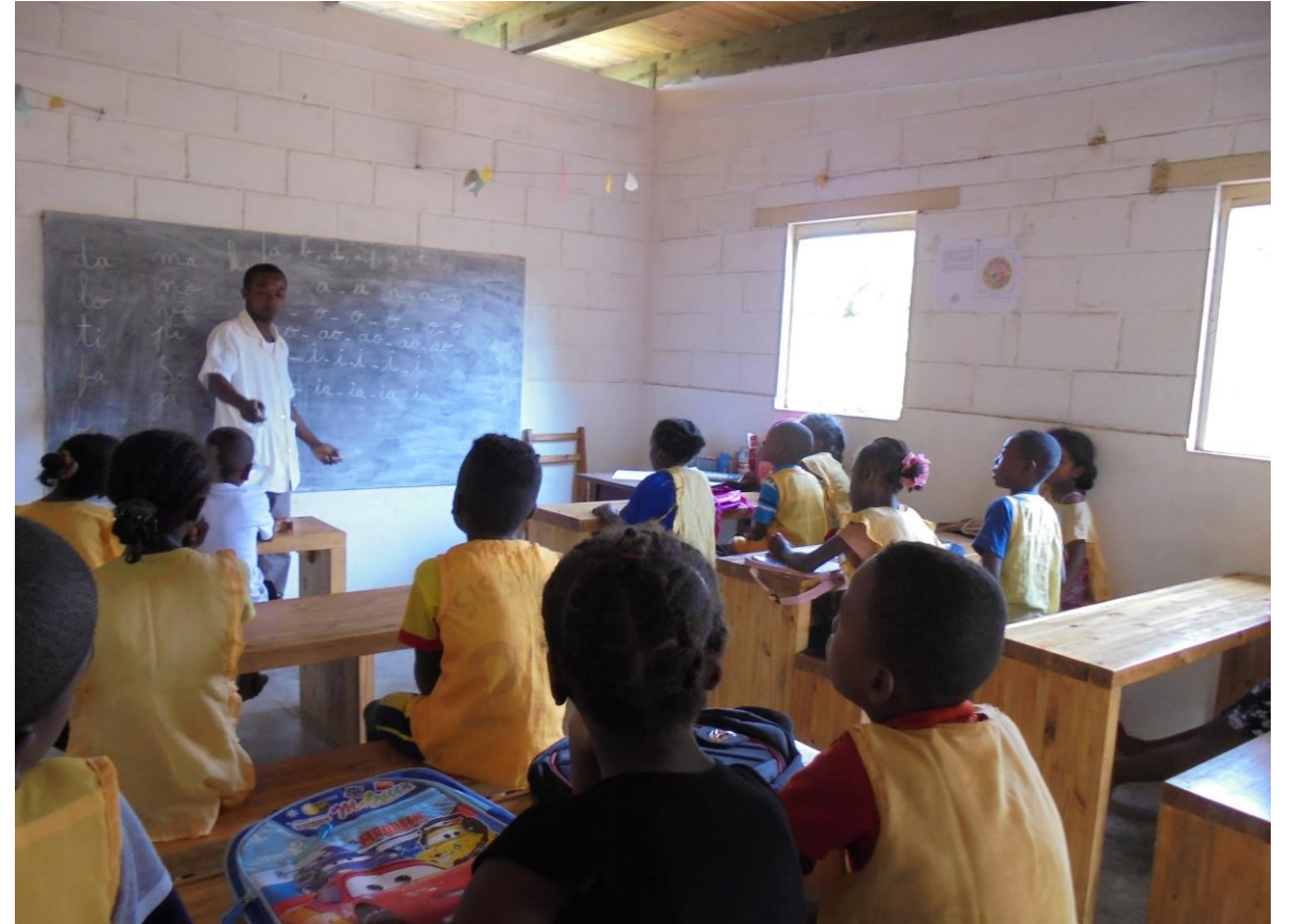
2013 : Achat du mobilier pour les deux salles de classe