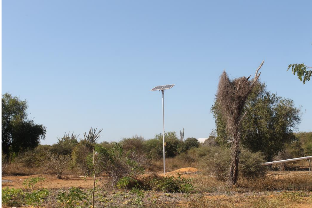
2015 : Installation d'une pompe solaire