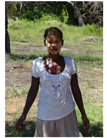
TALINIKI : cuisinière