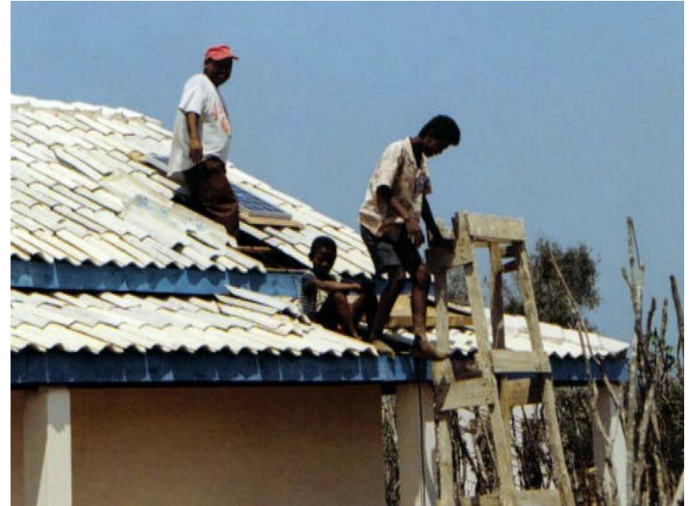
Installation d'un panneau solaire