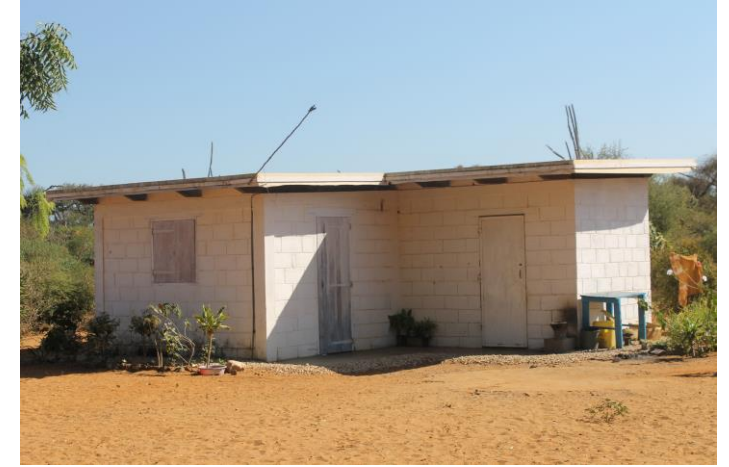
Aménagement d'un logement pour l'institutrice et sa famille.