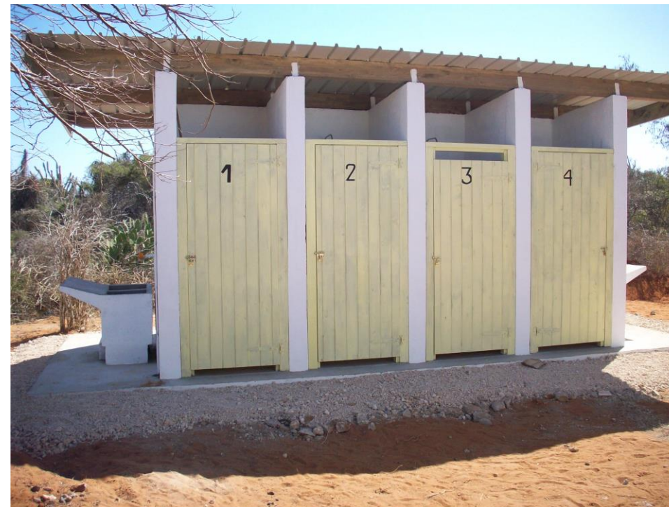
2013 : Réfection du bloc de sanitaires endommagé par le cyclone.