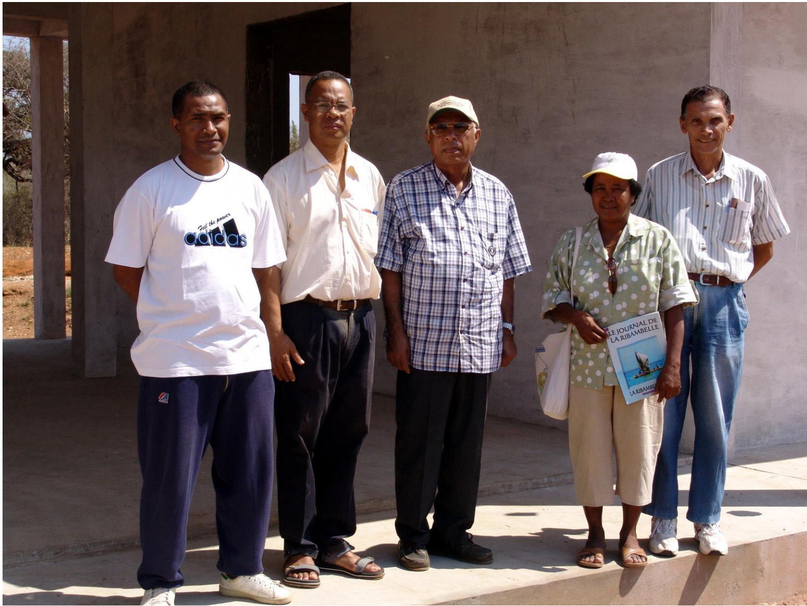
Création de l'association jumelle NY FARIBOLANA dont le siège est à Tuléar