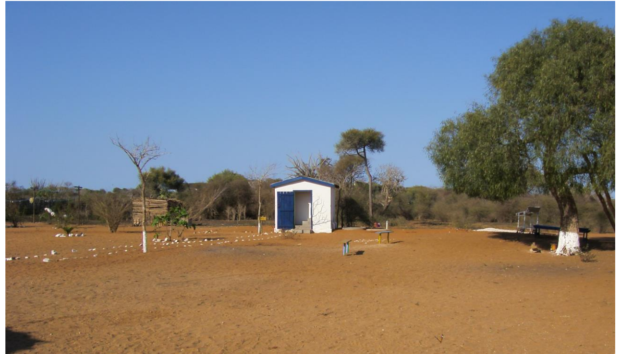
Construction de latrines